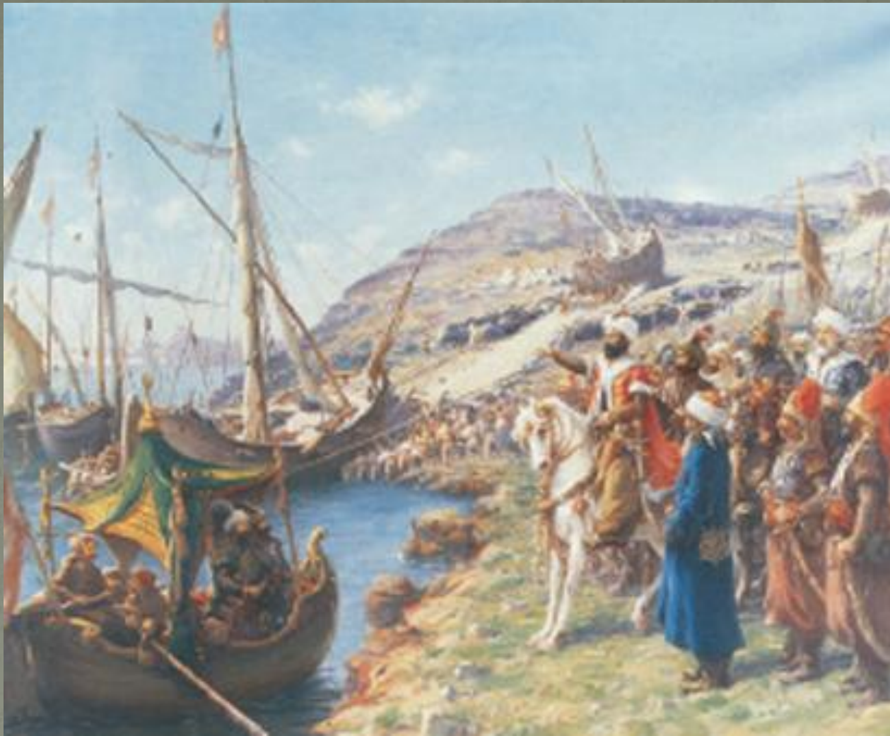
Ο Μωάμεθ παρακολουθεί το πέρασμα των караβιών στον Κεράτιο από τη στεριά. (Πίνακας του Φαούστο Ζονάρο, Κωνσταντινούπολη, Παλάτι Ντολμαμπαχτσέ, 1908).