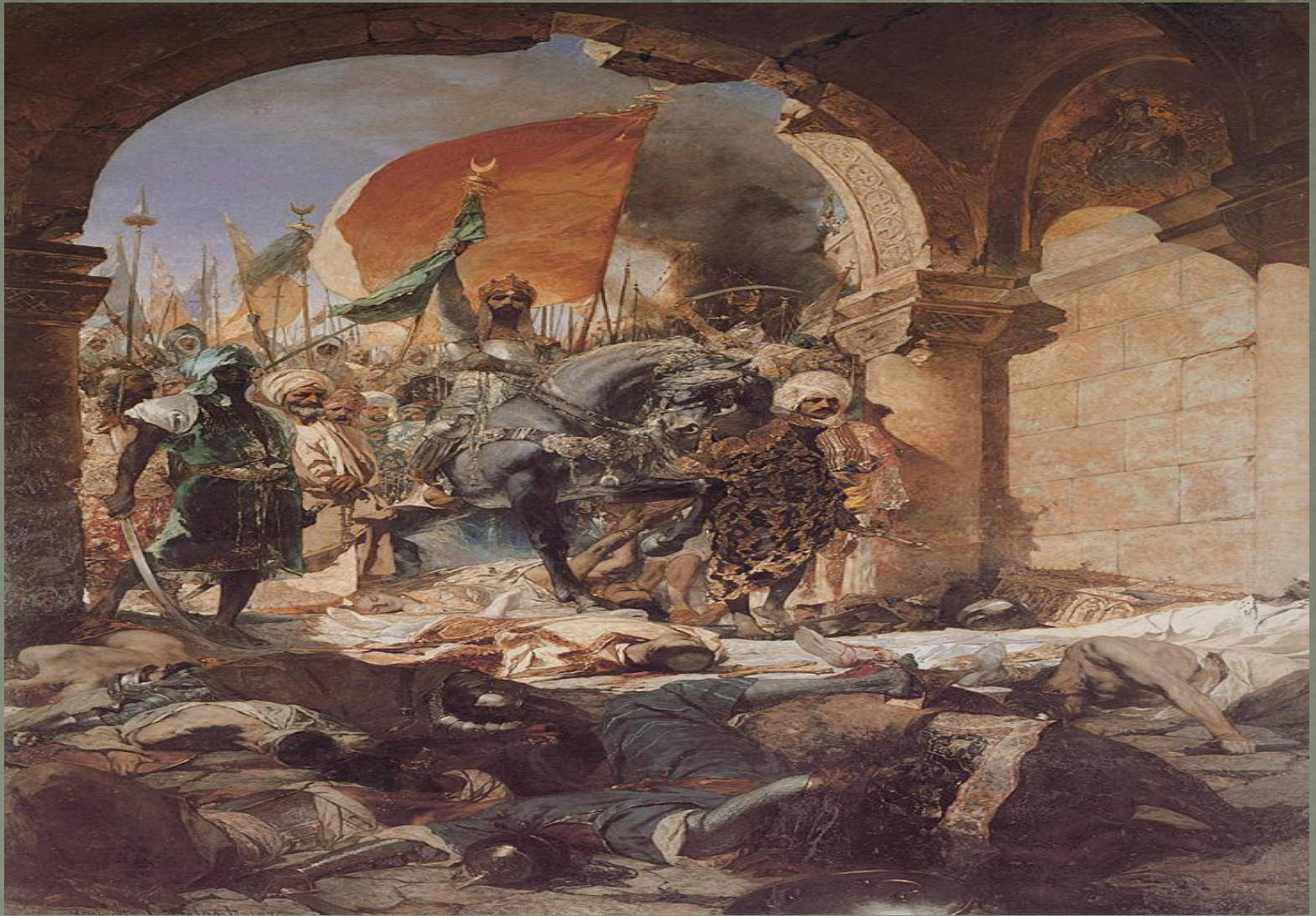
Benjamin Constant The Entry of Mahomet_II into Constantinople