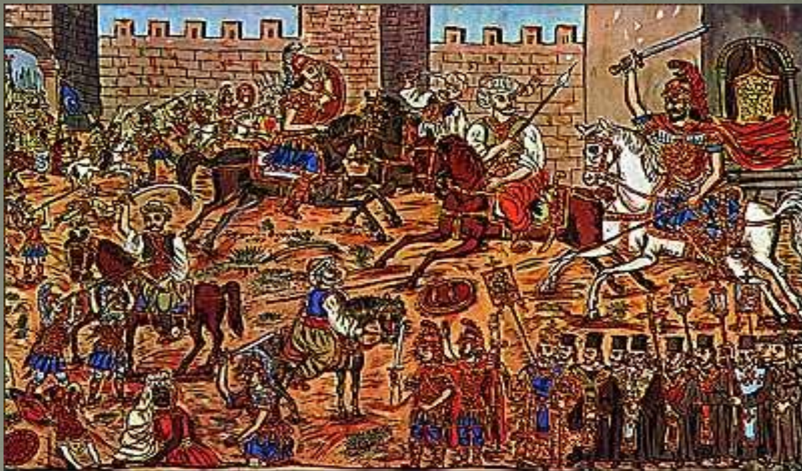
Θεόφιλος Χατζημιχαήλ Κωνσταντίνος Παλαιολόγος εις μάχην 1453, Μυτιλήνη μουσείο Θεόφιλου