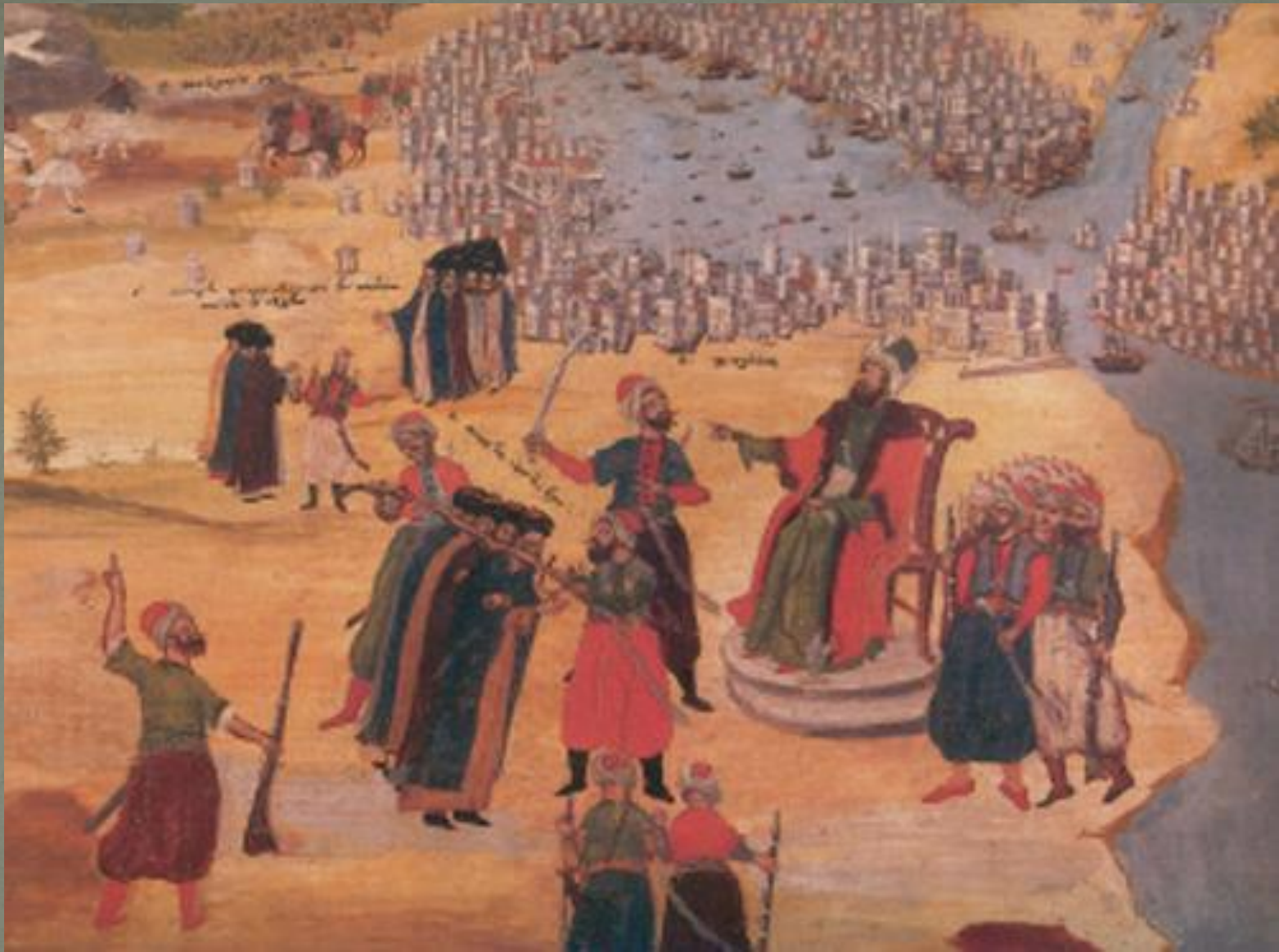
Η πολιορκία της Κωνσταντινουπόλης (Σκέψις Μακρυγιάννη, πίνακας Π. Ζωγράφου, 1836).